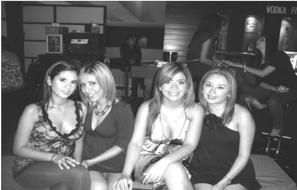
En la sociedad salvadoreña, exhibirse a través de la forma de vestir es un medio para destacar partes del cuerpo que se califican como “deseables” y que son importantes para los rituales de cortejo.

Si el vestir es una invitación al diálogo, es más precisamente al diálogo que se busca. Por lo tanto, existen estrategias a través del vestido como medio expresivo para competir con éxito en el mundo de la seducción. En la socie-