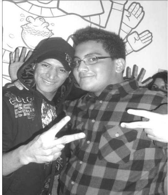
Este estilo es un reflejo de la importación de modas, basado en un género de música: el reguetón.

El estilo reguetonero goza de popularidad, principalmente en sectores llamados “populosos” del gran San Salvador. En Soyapango e Ilopango puede notarse una preferencia singular por esta manera de vestir. Sin embargo, en La Gran Vía no es común encontrar jóvenes vestidos con estas características. De hecho, no se ven.