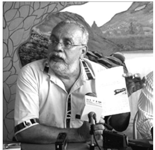
Estas personas expresan por medio de su estilo de vestir su oficio de artista, intelectual y humanista.

Estas personas expresan, a través de la totalidad de su vestir o con algún aditamento o accesorio en su cuerpo, su oficio de artista, intelectual, humanista o miembro de una ONG, universidad o simplemente su pretensión de serlo. Este estilo en el vestir representa una posición antisistema, no en cuanto a una posición política, sino más bien en contra de un sistema tradicional de usos y costumbres, que en opinión de muchos tiende a uniformizar a la sociedad, negando las