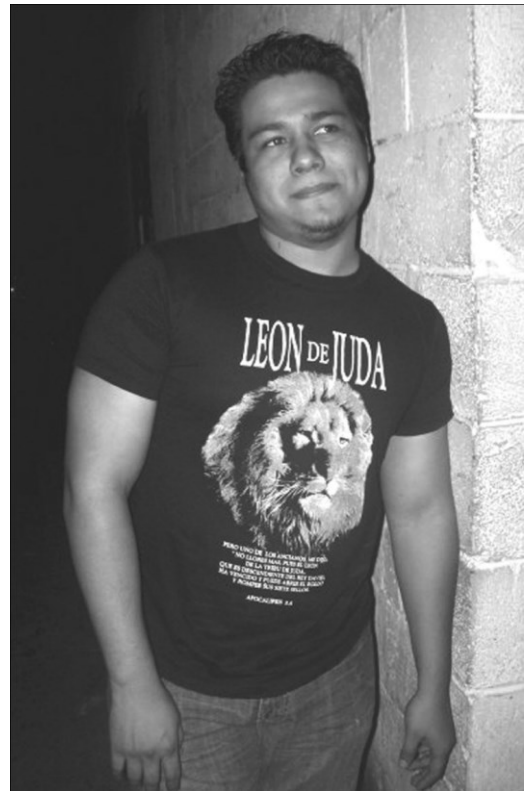
Las religiones han hecho de la comercialización de camisetas una insignia de sus adeptos

Salvador. Los “evangélicos” pueden llevar sus signos distintivos a extremos insospechados. Dos casos merecen mencionarse: el de la iglesia Elim y el del Tabernáculo Bíblico Bautista.