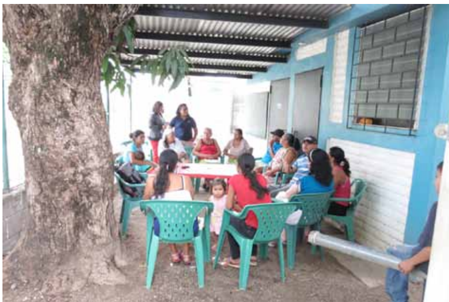
Figura 5. Vista del desarrollo del grupo focal en la comunidad El Coplanar, cantón El Cimarrón, municipio Puerto de La Libertad.

¿Cuál es el oficio o trabajo de la gente de El Coplanar? Ante este interrogante, se expresaban que trabajan en la agricultura de subsistencia, tanto hombres como mujeres. Por su parte las mujeres trabajan en los oficios domésticos de la casa. Cuando hay oportunidad de trabajo, van a lavar ropa a otras casas. Las mujeres estuvieron hace tres años en el Programa de Apoyo Temporal al Ingreso por 6 meses, recolectando basura. Muchos de los hombres que trabajan fuera de la comunidad laboran en fábricas (maquilas) y en la construcción como albañiles. Uno de los hombres tiene el oficio de marroquinería (elaboración de objetos de cuero como cinchos, carteras, billeteras y otros artículos). Otras mujeres tienen pequeñas tiendas de artículos domésticos y venden productos a través de catálogos.