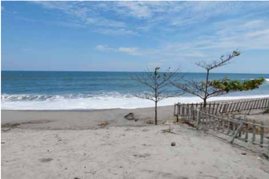
Figura 8. Vista de la playa San Diego desde uno de los hostales turísticos de la zona.

Adicionalmente están las historias relacionadas con la tradición oral de estos lugares: “La cuestión es que hay uno de los cerros (en el) que dicen que, como a las 12 del día, asustan se sienten cosas raras, una brisa rara, una vibración” . Esto es parte del recorrido y de la historia que los guías locales cuentan mientras conducen por algunos lugares de interés de la hacienda y playa San Diego, según el entrevistado.