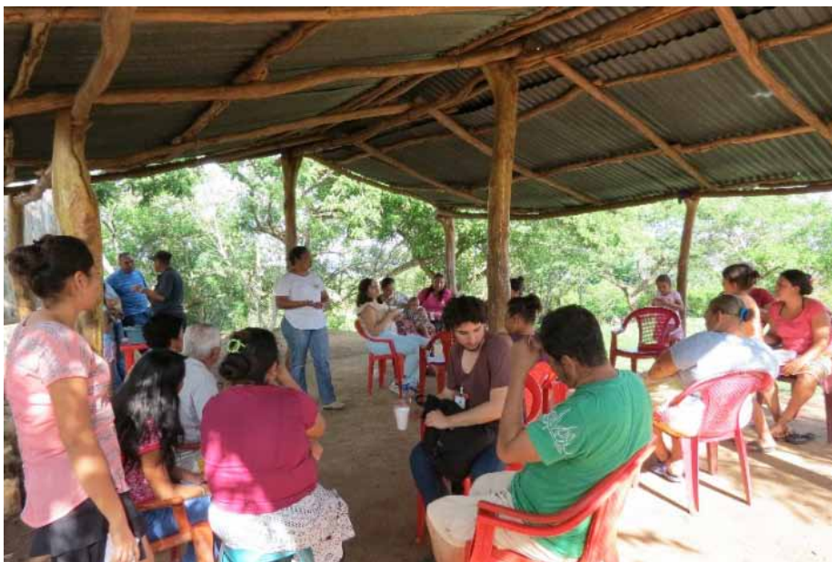
Figura 3. Vista del desarrollo del grupo focal llevado a cabo en la comunidad Los Ángeles, municipio Puerto de La Libertad.