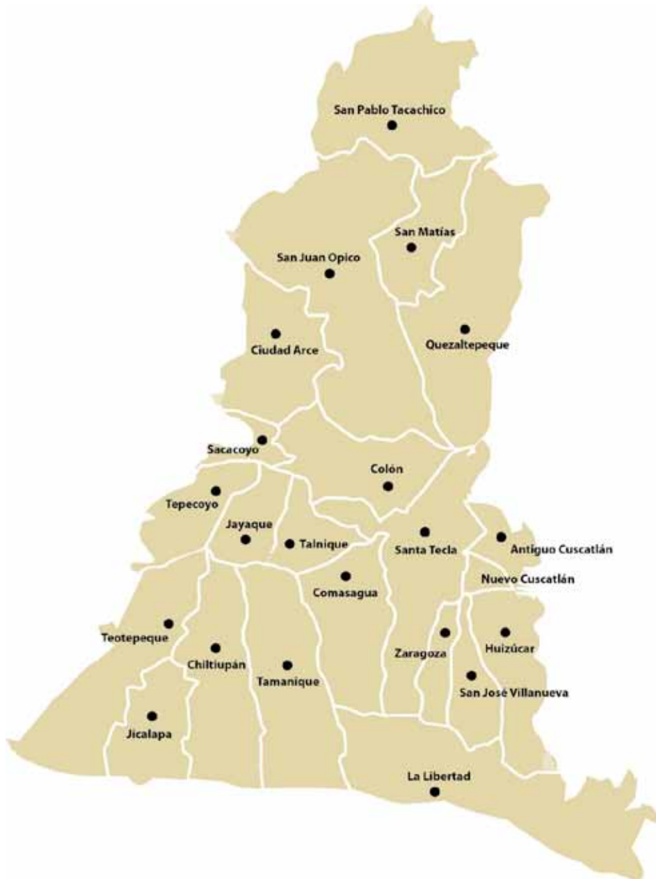
Figura 1. Mapa de municipios del departamento de La Libertad. Al sureste se ubica el municipio Puerto de La Libertad.