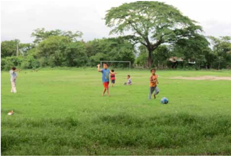
Figura 9. Vista de niños jugando fútbol en la cancha de la comunidad Tlacuxtli.

La señora, que dice ser originaria de Panchimalco, recuerda que sus padres y abuelos iban vestidos en huipiles y descalzos; además, le inculcaron el conocimiento de la medicina tradicional a través de las plantas. Esta misma señora recuerda que antes había “Brujos. Mi abuelo se hacía cuche, coyote y buey; con ello curaba a la gente. A una señora le sacó un muñeca del estomago” . En relación con esto, una de las lugareñas que venía migrando por la diáspora de la guerra de la década de 1980 asegura que le decían: “No pidan agua en cualquier lugar, porque la gente es mala; la gente se hace cuche” . Esto como parte de la memoria a partir del conocimiento que tenían de los lugareños de esta zona de cosmovisión indígena, como se ha visto en Huizúcar, Comasagua y Panchimalco (Erquicia, Herrera y Pleitez, 2013).