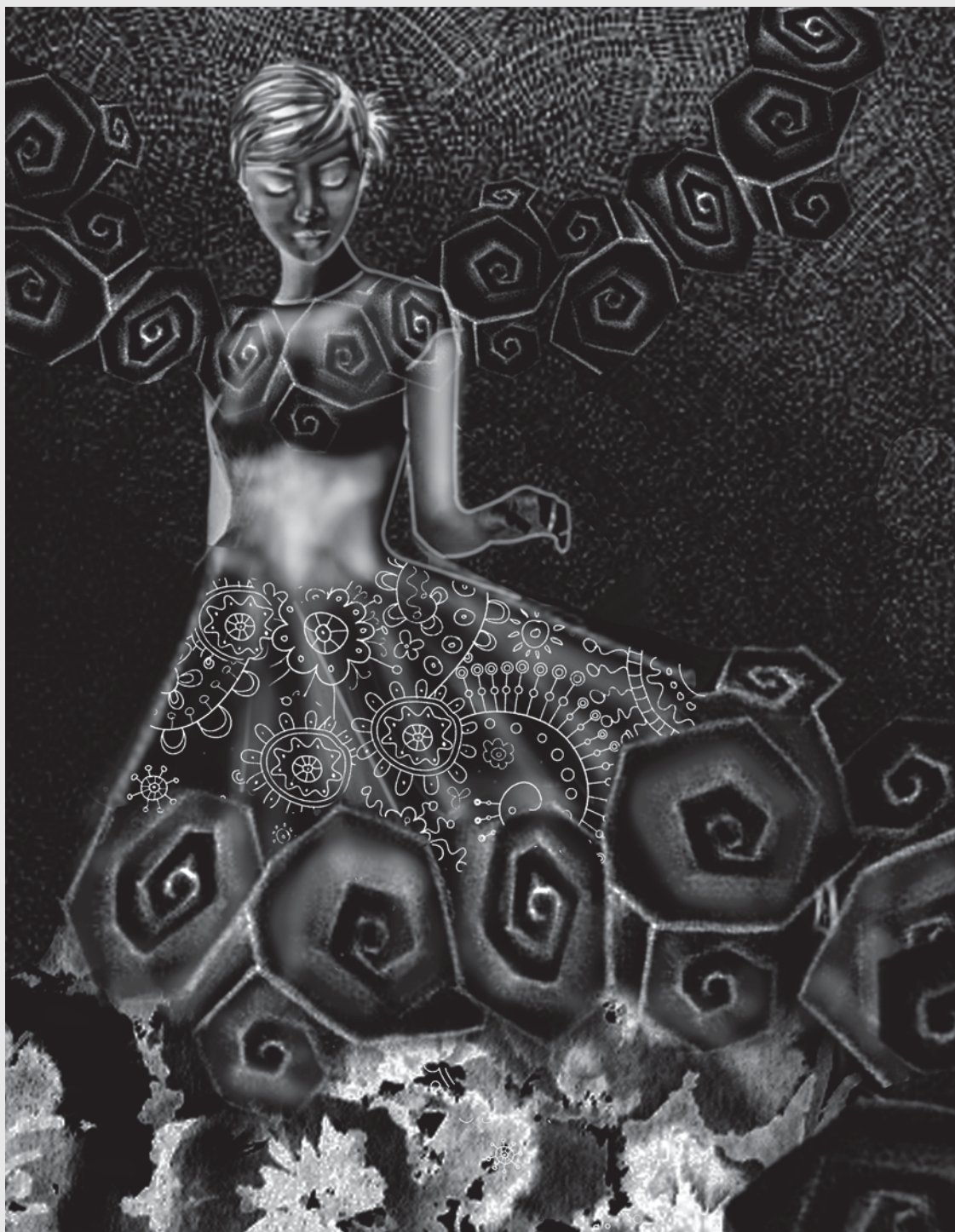
Ensueño. Técnica mixta, 8.5" x 11", Rita Araujo. 2013.