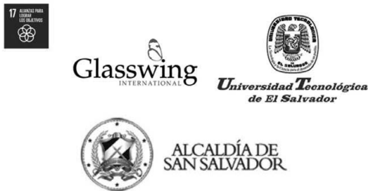
Figura 1. Instituciones interesadas en la ejecución del proyecto de urbanismo táctico en la calle Arce

La investigación se realizó desde el método cualitativo con enfoque descriptivo cuasi experimental (Hernández, Fernández y Baptista, 2003), ya que se buscó identificar los cambios de comportamiento —si los hubo— de los ciudadanos a partir de la observación de su andar sin contar con el control experimental completo (León y Montero, 2003).