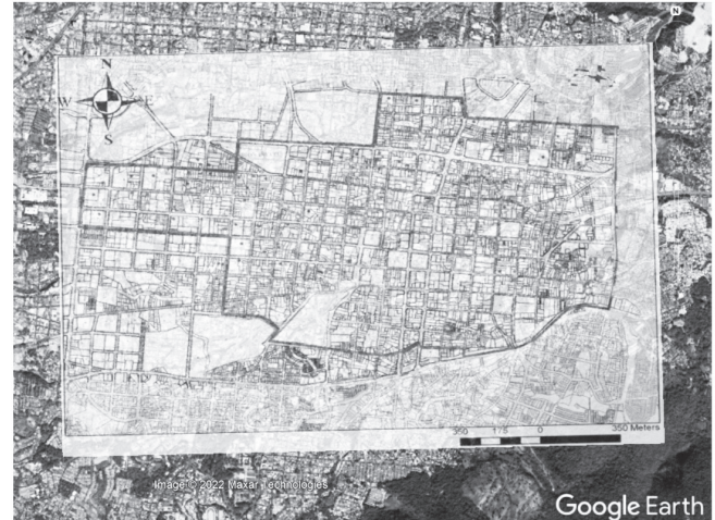
Figura 2. Área de intervención del proyecto urbanismo táctico, calle Arce

Ubicación del área (marcada con amarillo) por intervenir dentro del perímetro del centro histórico de San Salvador