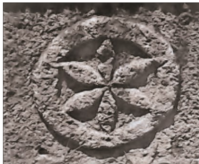
La Roseta Hexapétala The Six-petal rosette

Keywords: History, symbol, culture, identity, town