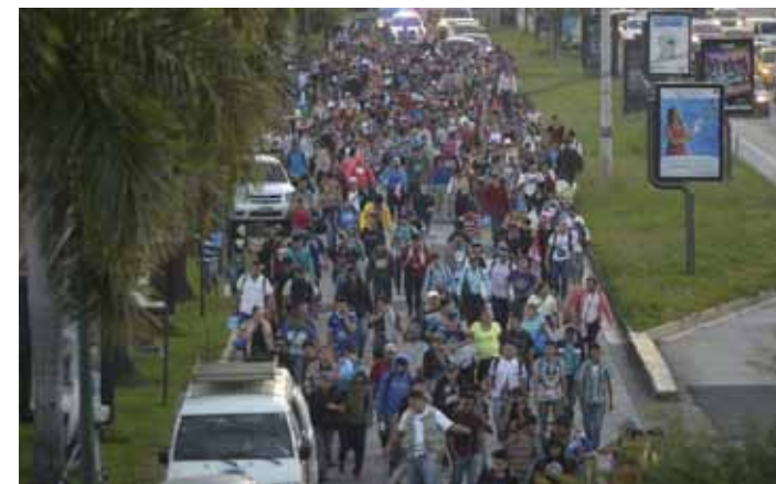
Pese a las amenazas que ha hecho el presidente de EE.UU., Donald Trump, y las advertencias que han realizado las autoridades salvadoreñas y organizaciones de inmigrantes sobre los riesgos que corren en el camino, así como de ser detenidos y deportados, la segunda caravana inició su recorrido. Tomado para fin educativo: www.elsalvador.com Foto EDH/Jessica Orellana