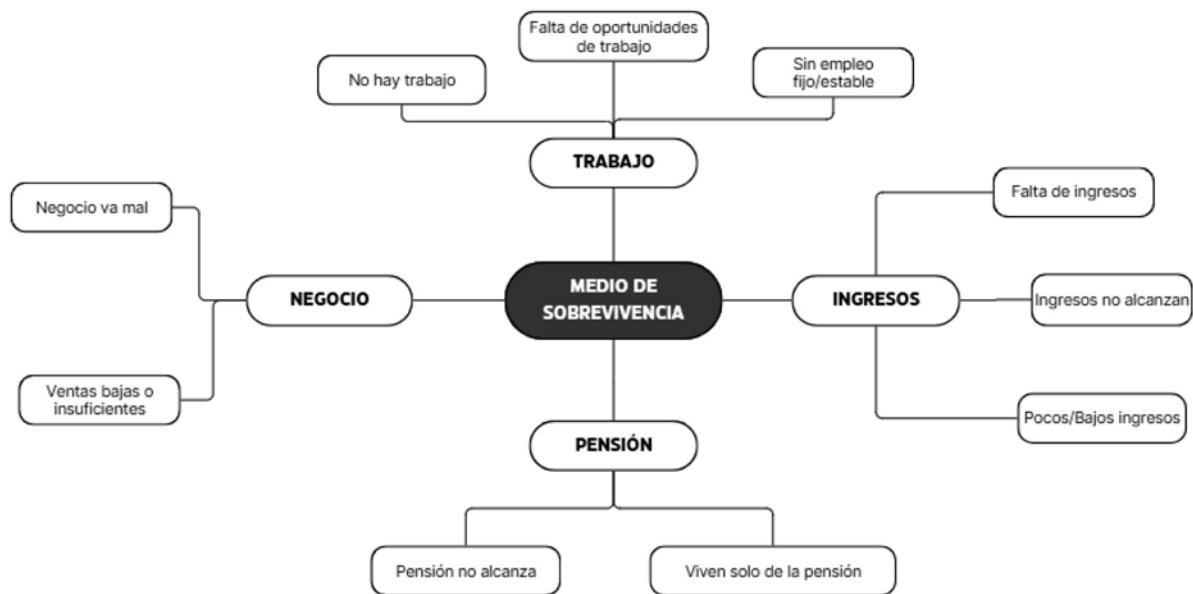
Figura 4 Esquema de categoría, subcategorías y códigos de medios de supervivencia

Los códigos con mayor repetición en esta categoría fueron los de ingresos económicos, con el 32,66 %. La codificación más repetida fue la percepción de que los ingresos no alcanzan, con el 12,68 %, seguido por la subcategoría de Trabajo , con el 15,14 %. Otros códigos mencionan que el negocio va mal, con 0,53 %, o que la pensión no alcanza para vivir, con el 2,74 %.