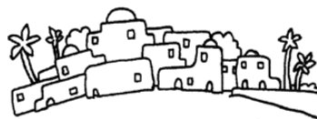
Insumos médicos hospitalarios "Belén".