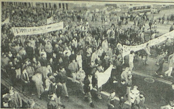
LEGALIZACION DE SOLIDARIDAD. Wrocław, Polonia, noviembre 13.— Millares de opositores polacos demandan al gobierno, la legalización de "Solidaridad", durante una manifestación que conmemoró el Septuagésimo (70º) Aniversario de la independencia polaca, después de la Primera Guerra Mundial.

En varias ocasiones el Presidente de Guatemala, Vinicio Cerezo, ha dicho que la cumbre se verificará los días 25 y 26 de noviembre, en San Salvador, mientras que el de Costa Rica, Oscar Arias, asegura por su lado en que no hay fecha definitiva para la reunión.