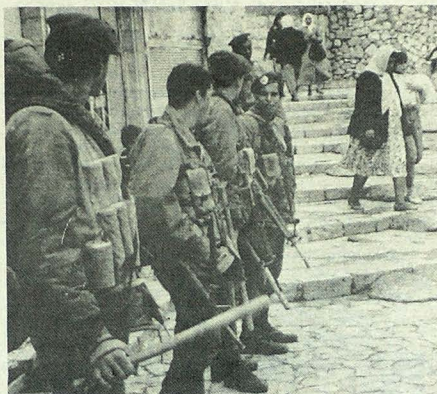
DESPLIEGUE MILITAR. Jerusalén, noviembre 13.— El gobierno israelí realizó un fuerte despliegue militar en la Ciudad Vieja de Jerusalén y en los territorios ocupados, para prevenir disturbios, por la reunión del Consejo Nacional Palestino, en Argelia, el sábado.